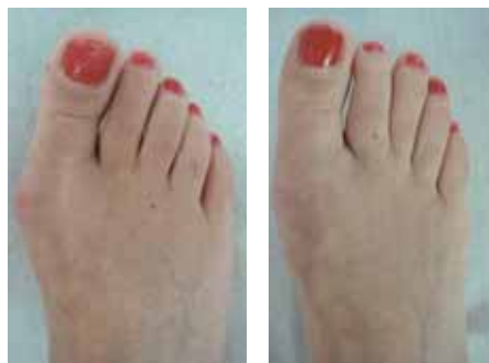
Links: Ein Hallux valgus vor der Operation. Rechts: Nach der Operation ist die Deformität der Großzehe beseitigt.

Dr. Zenta: Wenn der Schmerz durch Druck mit einem Finger im Mittelfußbereich ausgelöst werden kann, kann dies ein Hinweis auf eine Morton Neuralgie sein. Charakteristisch sind stechende oder brennende, oft auch elektrisierende Schmerzattacken im Bereich des dritten und vierten, mitunter auch des vierten und fünften Zehs. Dieses sehr unangenehme Krankheitsbild ist eine häufig übersehene Komplikation des Spreizfußes: Durch die unnatürliche Druckbelastung hat sich eine stecknadelkopfförmige Verdickung (Neurom) bestimmter Nerven zwischen den Mittelfußknochen gebildet.