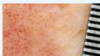
Fürs Auge unsichtbar: Millionen mikroskopisch kleine Behandlungspunkte.

prinzip des Fraxel-Lasers. Hierbei durchdringen Millionen mikroskopisch kleine Punkte die Hautoberfläche, ohne sie zu verletzen, um dann direkt an den Kollagenfasern in den tiefer gelegenen Schichten der Haut ihre stimulierende Wirkung zur Hauterneuerung zu entfalten. »Primär verantwortlich für die Faltenbildung der Haut ist die nachlassende Spannkraft und Ausdünnung der Kollagenfasern. Dieser Prozess lässt sich mit dem Fraxel-Laser nun ein ästhetisch überzeugendes Stück zurückdre-